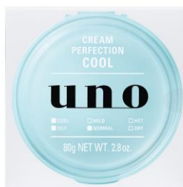
ウーノ クリームパーフェクション(クール)