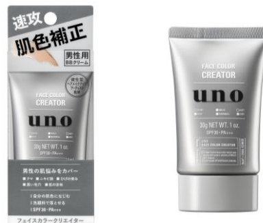
ウーノ フェイスカラークリエイター