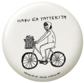
スーパーガールになるために

コラボに展示、縦横無尽に活躍中！弾む心をうつしたようなタッチで描かれた春の仲間たち。手にした瞬間から日常に溶け込んで、新しい生活を楽しむコンパクト