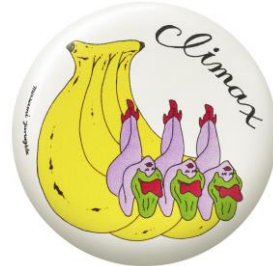
モギタテ色にクライマックスを謳う 魅惑のバナナ