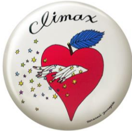
プリアトな胸騒ぎに 呪文を囁くハートフル

海外でも大人気！独特の世界観。エロチックをポップに擬態させ、まるで呪文をふりまくようにして、手にしたあなたを「春の素敵な予感」に誘い込むコンパクト