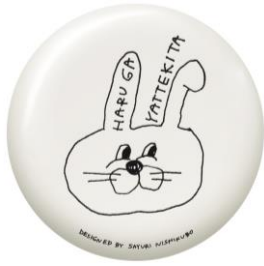
立ち上がり！何度でも