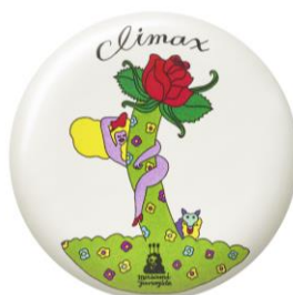
気まぐれメロディアスに ハミングな薔薇を咲かせるカトリヌ