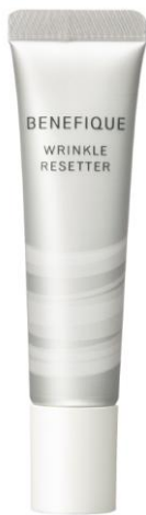
ベネフィーク リンクルリセッター

日々、お客さまに接しているBCのアイデアを活かした「ものづくり」を推進するプロジェクトから生まれ、資生堂リサーチセンターにて商品化することに成功したノーカラーコンシーラーです。