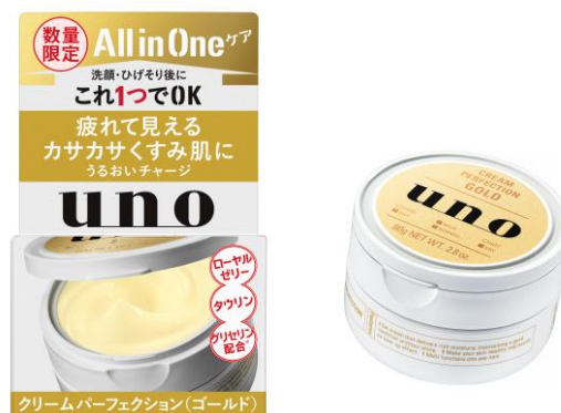
クリームパーフェクション(ゴールド)