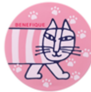
ラッキーチャームカラー LL ピンク