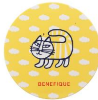
ラッキーチャームカラー LL イエロー

リサのヴィンテージ作品のパターンから生まれたキャラクター。子どもの頃のマイキーのように見えたり、マイキーの子どものように見えたり。