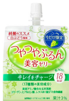
つやつやぷるんゼリー （白ぶどう風味）

そこで綺麗のススメは、「小腹を満たしながら体の中から綺麗を手に入れたい」「カロリー制限しながらおやつを楽しみたい」と考える現代女性たちに向けて、フレッシュな果実感の「綺麗のススメ つやつやぷるんゼリー（白ぶどう風味）」と、カロリーの心配がない「綺麗のススメ つやつやぷるんゼリー（カロリーゼロ）」を数量限定で発売します。