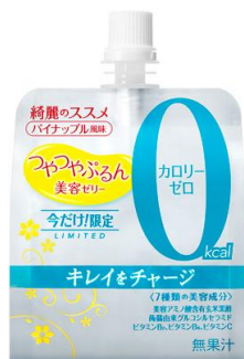
つやつやぷるんゼリー （カロリーゼロ）