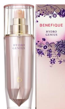
ハイドロジーニアス ※箱デザイン変更