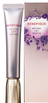
レチノリフトジーニアス (医薬部外品)