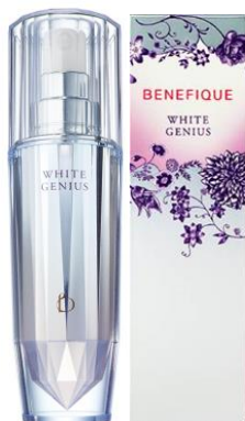
ホワイトジーニアス (医薬部外品)