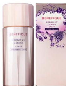
ハイドロUVジーニアス(UV&IR)