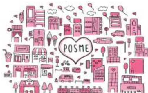
【POSME はさまざまな商品・サービスに展開します】