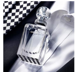
エムジー5×五大陸ビジュアル

資生堂「エムジー5」は、今年誕生25周年を迎えたオンワード樺山の紳士服ブランド「五大陸」とコラボレーションを展開します。「五大陸」は、2017年秋冬シーズンのテーマ「NEXT GENERATION - A GENT RING」のイメージソースが昭和30・40年代のニッポンで、この時代のファッションや文化を昇華し、「レトロ・ジャパニーズ・モダン」として打ち出していくにあたり、当時のお洒落な男たちを席卷した「エムジー5」に着目したことから実現しました。「エムジー5」の黒とシルバーのダイヤモンドカットがデザインされた、ネクタイ、タイバーと、「エムジー5」発売当時の広告キャラクターをイメージしたタートルネックセーター、ポケットチーフを、「資生堂エムジー5 オードトワレ」と同日発売となる、10月21日(土)に発売します。