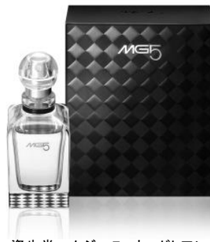
資生堂エムジー5 オードトワレ