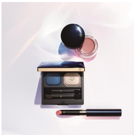
クレ・ド・ポー ボーテ 2017 年 1 月 21 日(土)発売 カラーメーキャップ新製品 (上から) 「ブラッシュクレーン 4」 「オンブルクルールデュオ 105」 「ルージュエクラ C 238」

(* Serene beauty 【英】セリーン ビューティー: 静謐な美しさ)