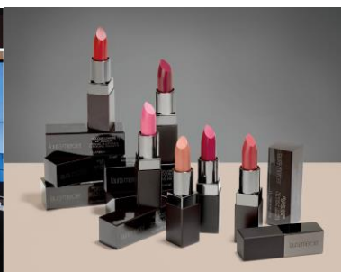
「ローラ メルシエ」商品