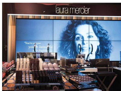
「ローラ メルシエ」店頭