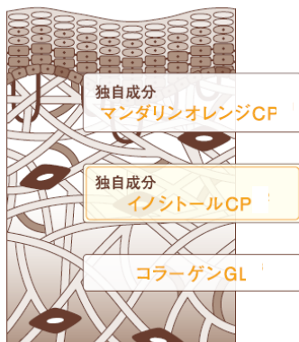
肌断面イメージ図

肌に触れた瞬間から すみずみまでうるおいで満たし、 湧き上がるようなハリと透明感あふれる肌へ導く【薬用】乳液