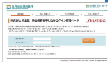
申し込みフォームトップ画面

https://smartweb6.eventissimo.jp/public/seminar/view/166